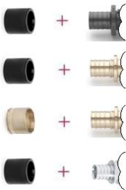
Fig. 1: RAUTITAN flex koppelstuk

Specifiek voor verwarming zijn T- en L-aansluitgarnituren in roestvast staal voorzien.