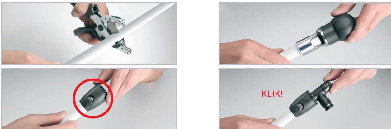
Fig. 2 Procedure montage