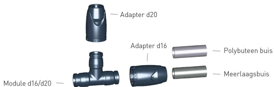
Fig. 1 Principe verbindingssysteem