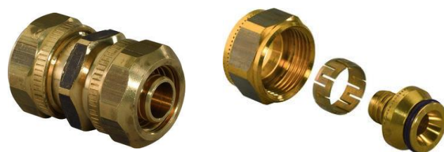
Fig. 3: Raccords droits et raccords de collecteur Euroconus

Ils sont livrés dans des sacs en plastique rangés dans des emballages en carton indiquant le type, le numéro d'article et le nombre.