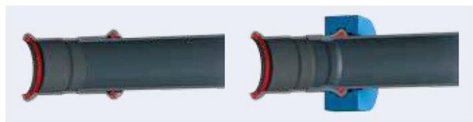
Fig. 1: – dwarse doorsnede voor en na het persen

Door de materiaaleigenschappen van de buis en de persfitting vervormen deze gelijktijdig en gelijkmatig op twee plaatsen onder inwerking van de persbekken of -kettingen van de persstang. Een eerste vervorming achter de perskraag leidt tot een trekvast verbinding van persfitting en buis. Een tweede vervorming, vanuit drie richtingen, ter hoogte van de perskraag en dus de dichtring, leidt tot een dichte verbinding van persfitting en buis. De dwarse doorsnede (figuur 2) toont de fitting vóór en na het persen.