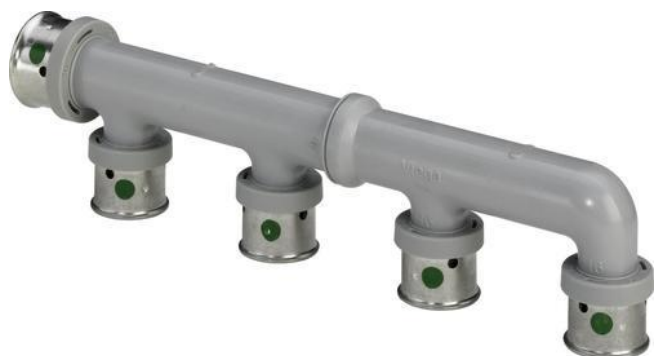
Figuur 1: Kunststof collectoren of verdelers

De verschillende collectoren of verdelers worden vermeld op de viega Smartpress prijslijst van Viega. De toevoerdiameter bedraagt 20 mm; de vertakking (2, 3 of 4) bedragen 16 mm.