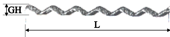
Fig. 2: Vorm van de XOREX staalvezel