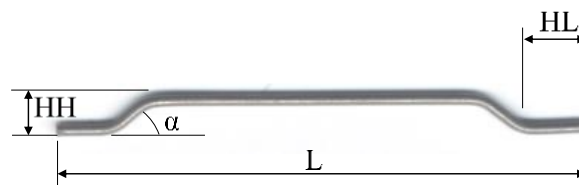
Fig. 1: Vorm van de FICON staalvezel