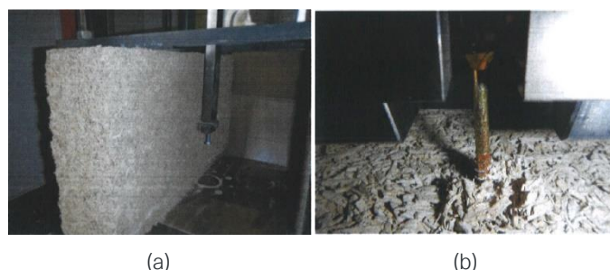
Fig. 2 – Configuration d'essai - résistance transversale (a) et axiale (b) des fixations dans un bloc de chanvre ISOHEMP

La résistance transversale et axiale (traction) des fixations dans le bloc de chanvre ISOHEMP a été déterminée suivant une méthode adaptée basée sur l'Annexe B de EAD 330232-01-0601, voir Fig. 2. Les résultats sont repris dans le Tableau 4.