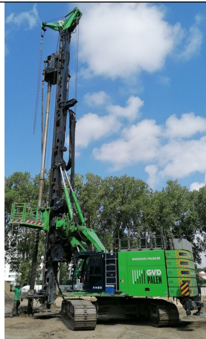
Fig. 2 : Exemple de machine à pieux