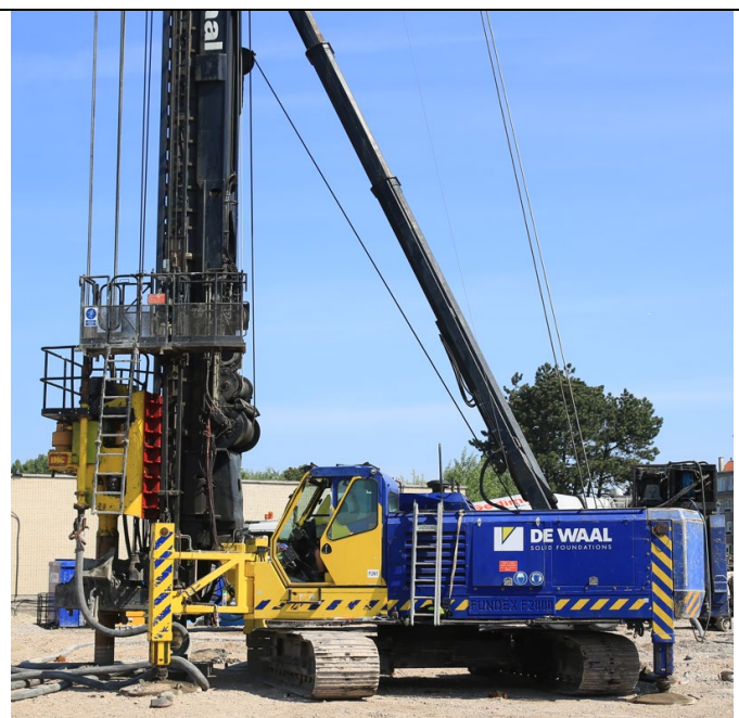
Fig. 2 : Réalisation du pieu à refoulement