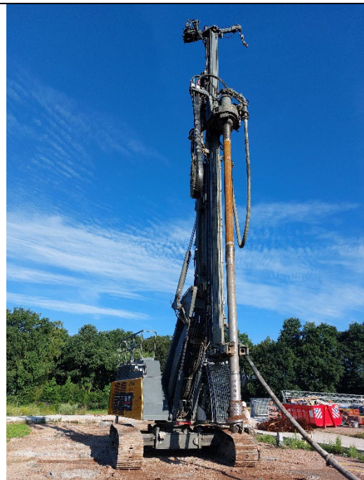
Fig. 2 : Voorbeeld van een palenmachine