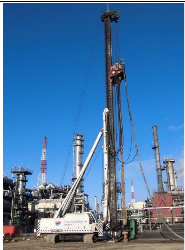
Fig. 2 : Exemple d'une machine à pieux équipée d'une tarière Omega