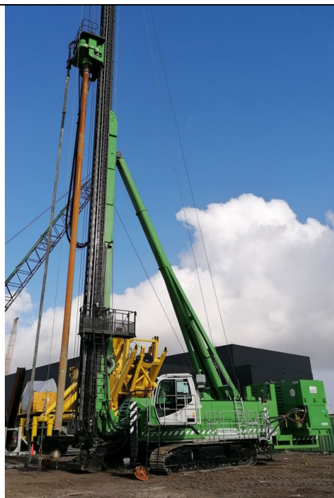
Fig. 2 : Exemple de machine à pieux