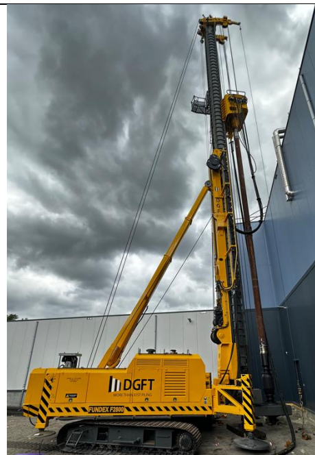
Figuur 2: Uitvoering van de grondverdringende paal