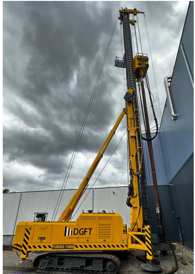
Figuur 2: Uitvoering van de grondverdringende paal